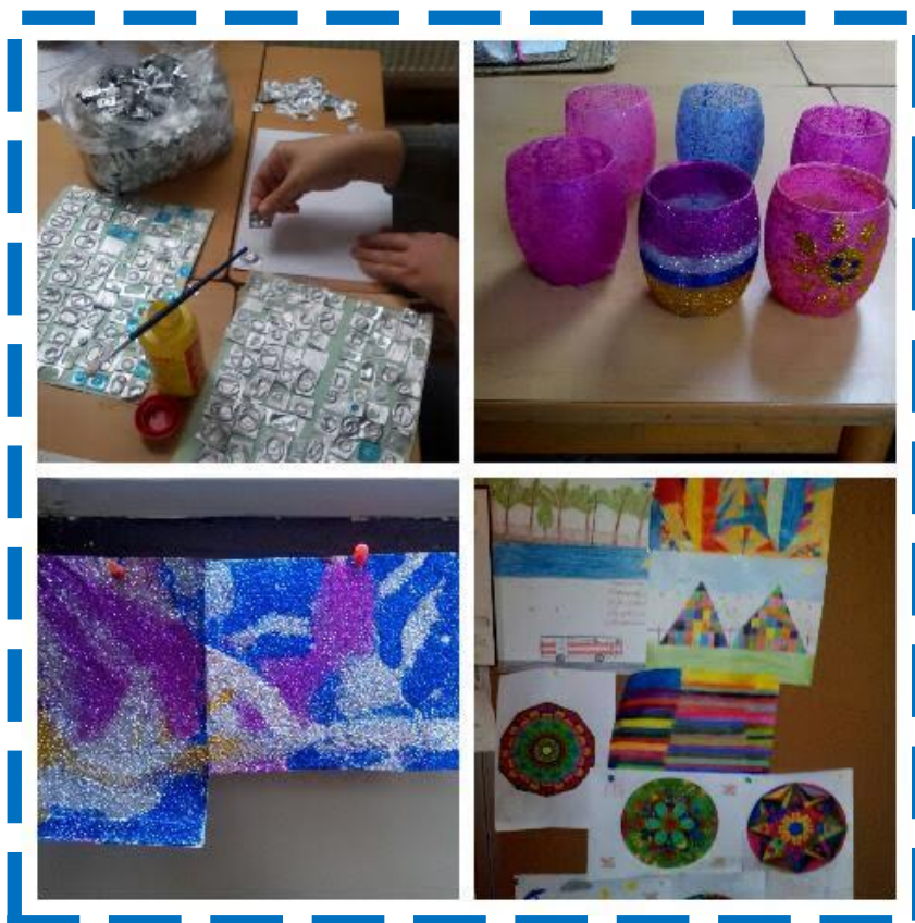
Kreativní chvílky na chráněném bydlení